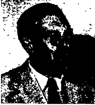
[صورة السير جيمس مع موجز لسيرته]

- كان جيمس روبرتسون يخطط منذ سنوات شبابه الباكر، قبل أن يبارح مدينته دندي باسكتلندا، للعمل بالهند، مترسماً خطى والده وجده اللذين عملا هناك لعشرات السنين، لكن تواتر الأنباء عن حدوث اضطرابات بالهند جعله يعيد النظر في خططه، لذا بدأ يعد العدة للعمل بالسودان بعد تخرجه من أكسفورد.