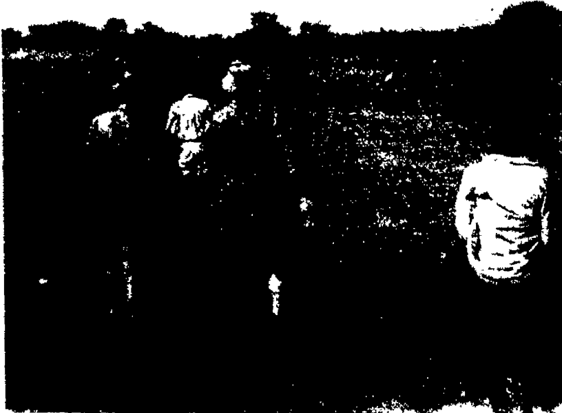
المؤلف في وسط الصورة وبصحبة مفتشي المركز وهما يخوضان ماء نهر شل في مديرية بحر الغزال في طريقهما من أويل إلى راجا عام ١٩٥١ .