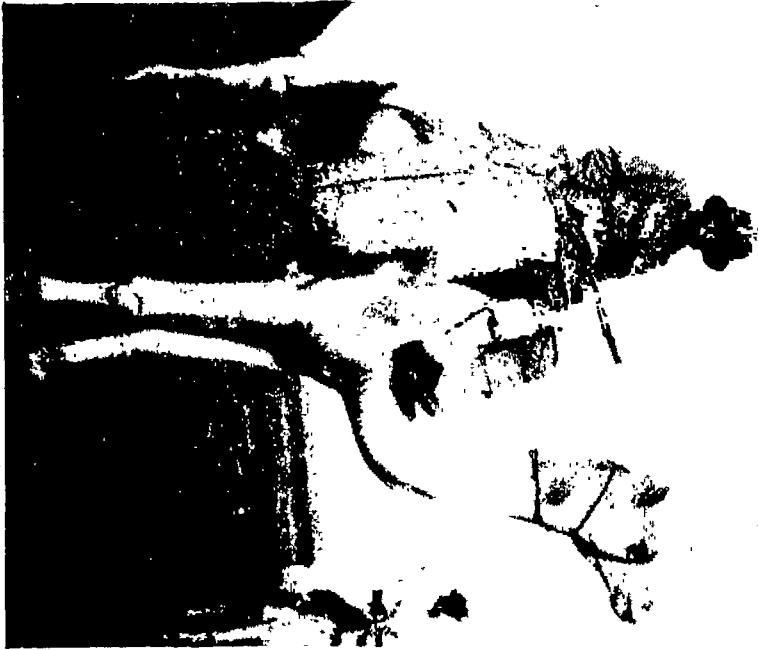
الموقف معطياً جملًا أثناء جولة في مركز القطيفة عام ١٩٣٧