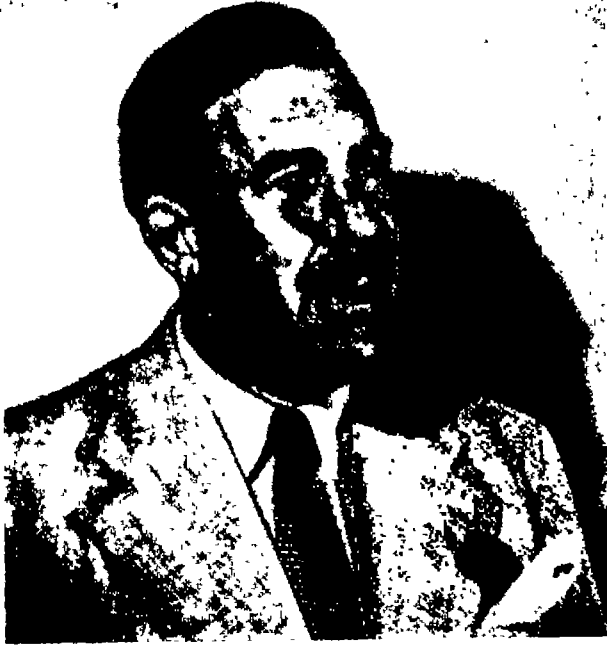
المؤلف عندما كان سكرتيراً إدارياً عام ١٩٥٠